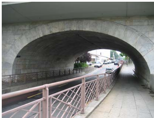
Passage existant sous le pont de la Coulouvrenière

Ce passage entre les deux quais sera mieux valorisé et mieux appréhendé, particulièrement par les piétons.