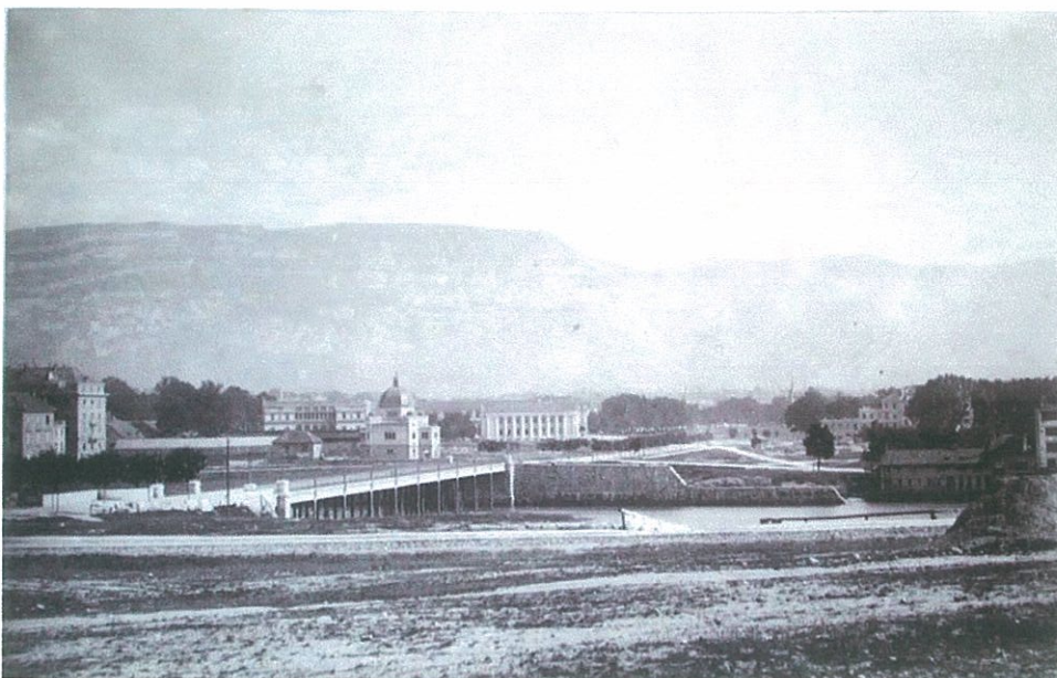
Fig. I. photographie d'archives, la Coulouvrenière et Plainpalais, vers 1860

Le Temple Unique, tout comme l'église anglicane, l'église russe et la Synagogue fait partie de cet ensemble d'édifices culturels édifiés sur des terrains concédés par l'Etat dans le périmètre de la ceinture faziste. Leur construction est liée au nouveau régime politique radical de James Fazy qui, dès 1846, instaure la liberté de culte et affirme son idéal de tolérance religieuse en facilitant la construction de ces bâtiments.