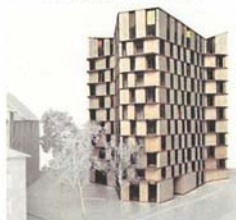
La Tour des Grottes A quoi ça ressemblerait...

Un immeuble sélectionné dans le dos du quartier par un jury d'« experts », qui a fait l'objet d'une vive contestation dans le quartier et s'est attiré les critiques de nombreux architectes et urbanistes pour la faible qualité de ses logements et son gabarit démesuré.