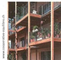
La Coopérative des Grottes A quoi ça pourrait ressembler...

Pour une participation des habitants à la construction de leur ville : les personnes qui vivent ou travaillent dans un quartier doivent avoir leur mot à dire sur les aménagements qui impacteront leur quotidien. La « participation citoyenne », clef de voûte du développement durable, ne doit pas rester une promesse de politiciens.